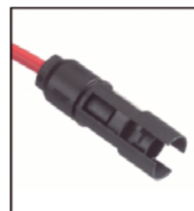
Male Cable Coupler