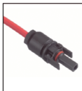
Female Cable Coupler